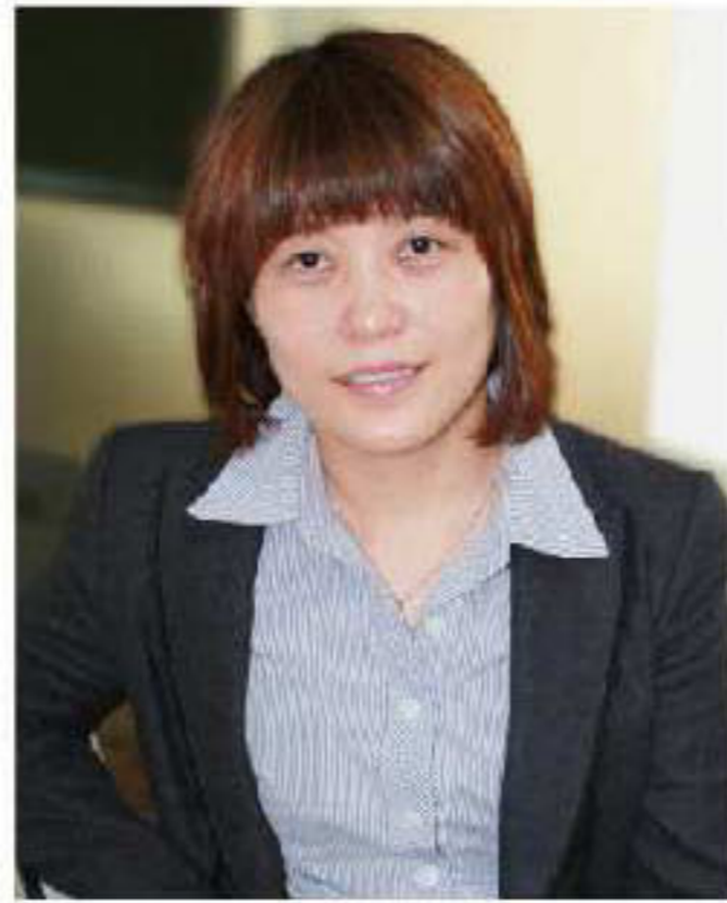
Bin Gu Geschäftsführerin