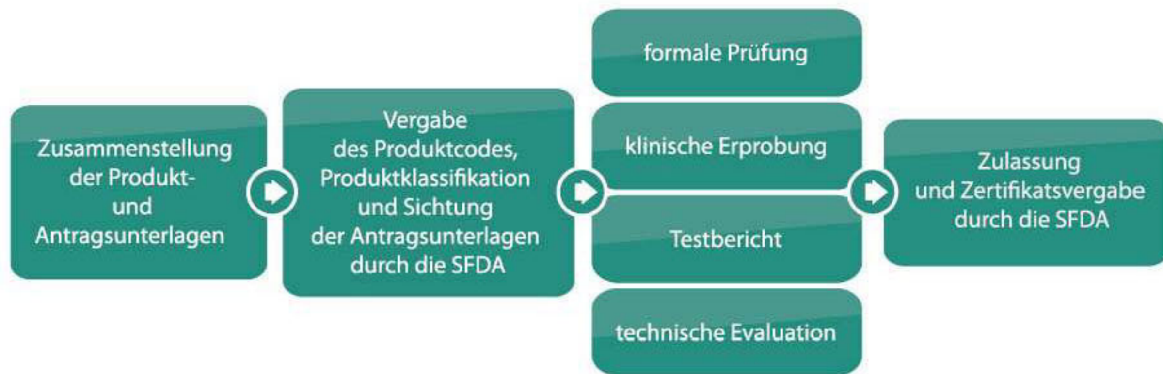
Abbildung 4: Vereinfachte schematische Darstellung der Lizenzierung medizinischer Produkte für den chinesischen Medizinmarkt durch die State Food and Drug Administration (SFDA)*

Wir unterstützen Sie bei der Lizenzierung Ihrer Produkte für den chinesischen Markt. Die komplexen Verfahren, die Ihre Produkte bis zur Markteinführung in China durchlaufen müssen, sind uns aus mehrjähriger Erfahrung bekannt. Wir beraten Sie je nach Produktkategorie und -klasse hinsichtlich der optimalen Vorgehensweise sowie Zusammenstellung ihrer Unterlagen und Dokumente und sorgen dafür, dass diese termingerecht bei den entsprechenden offiziellen Stellen vorliegen.